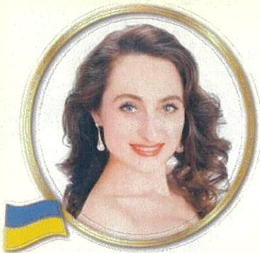
ソプラノ オクサーナ・ステパニユック