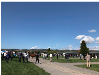
たくさんのお客で賑わったHBA1歳セール