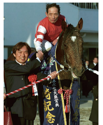
エスプリシーズンで勝利した川崎記念