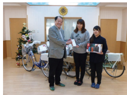
社会福祉法人 新日本学園