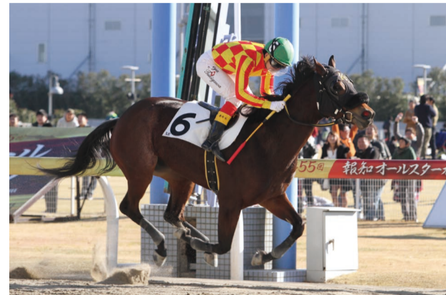
スパロービートの愛娘グローリアスサードの記念すべき初勝利シーン

今年に入り、1月1日の川崎開催で、川崎生え抜き種牡馬スパロービートの初年度産駒グローリアスサード（馬主・日下部勝徳様、高月賢一厩舎）が優勝。スパロービートは2009年1月の船橋記念を勝ち、その年の北海道スプリントカップを3着。ちょうど自身が重賞初制覇をしてから10年後に、記念すべき産駒初勝利を挙げました。父も母もこの愛娘も、日下部オーナー＆高月厩舎という夢とロマンの結晶です。