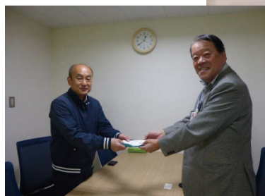
社会福祉法人 ル・プリ ぼらいとえき