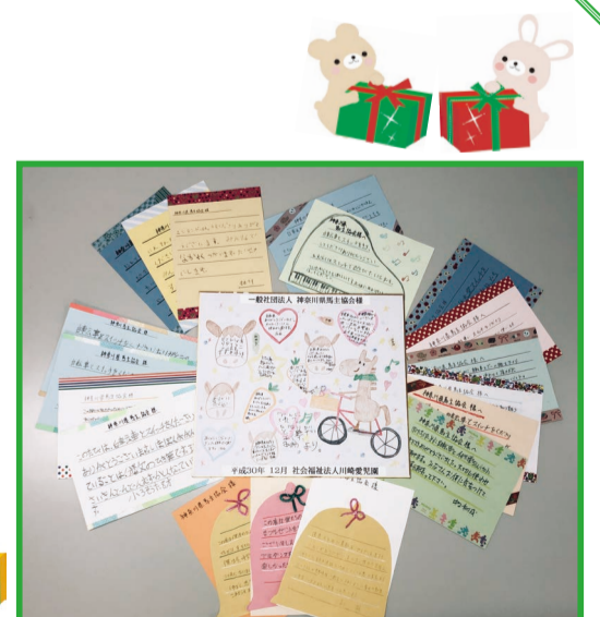
施設のみなさんから あたたかいお礼のお手紙を頂戴しました！